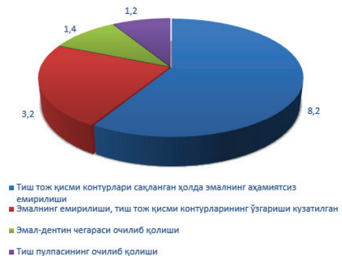
Расм 2. Тишлар қаттиқ тўқималари эрозив емирилишининг турли чуқурлиги тарқалганлик кўрсаткичлари

соҳалари мавжуд бўлган зарарланишлар ташкил этди, 29,4% – эмалнинг емирилиши тиш тож қисми контурининг аҳамиятли ўзгариши билан, аммо дентин призмалари тўла реминерализацияга учрамаган ва эмалнинг нотўлиқ нуқсони аниқланди.